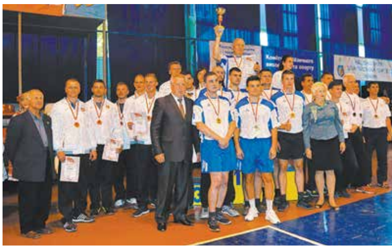
Під час урочистої церемонії нагородження переможців спартакиади