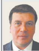
Геннадій ЗУБКО, віце-прем'єр-міністр України:

«Наш Уряд виділив додаткові 400 млн грн на програму «Теплі кредити». Для громадян це означає, що вони можуть скористатися ними для заміни газових котлів, утеплення помешкань, енергомодернізації ОСББ. Майже 280 тис. українців вже скористалися можливістю кредитування для утеплення та модернізації помешкань України».