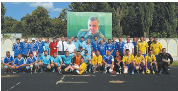
Колективне фото учасників футбольного турніру