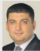
Володимир ГРОЙСМАН, Прем'єр-міністр України:

«Наш Уряд виділив додаткові 400 млн грн на програму «Теплі кредити». Для громадян це означає, що вони можуть скористатися ними для заміни газових котлів, утеплення помешкань, енергомодернізації ОСББ. Майже 280 тис. українців вже скористалися можливістю кредитування для утеплення та модернізації помешкань України».