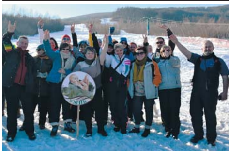
Кращі спортсмени обласних змагань медиків з гірськолижного спорту