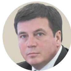
Геннадій ЗУБКО, віце-прем'єр-міністр, міністр регіонального розвитку та будівництва:

«Сьогодні перед Україною постав великий енергетичний виклик. Ми повинні перейти до реального ринку: прозорого механізму взаєморозрахунків, відповідального споживання та якісних послуг для громадян. Повномасштабна модернізація житлового фонду може скоротити споживання газу в Україні на 9 млрд кубометрів на рік. Однак для її реалізації треба залучити й ефективно використати 40 млрд євро інвестицій».