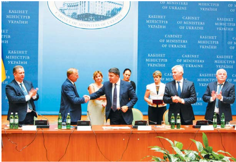
23 серпня 2016 року укладено Генеральну угоду на 2016-2017 роки між Урядом, профспілками та роботодавцями