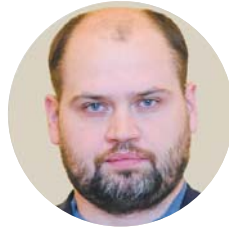
Андрій ЖУРЖІЙ, народний депутат України, заступник голови Комітету ВРУ з питань податкової та митної політики:

«Підприємці звикли, що довгостроковий план розвитку з урахуванням податкового навантаження їм не збудувати. За словами «ліберальна реформа» і «поліпшення інвестиційного клімату» відчувається посилення процедур моніторингу та контролю підприємницької діяльності. І ведення бізнесу в Україні об'єктивно все більше нагадує війну за право заробляти гроші».