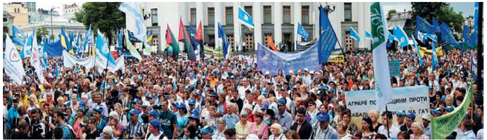
6 липня і 8 грудня десятки тисяч спільно відстоювали власні конституційні права на гідний рівень життя під час всеукраїнських акцій протесту профспілок

Закон України від 6 грудня 2016 «Про внесення змін до деяких законів України» у 2017 році відновлюються норми ЗУ «Про загальнообов'язкове державне пенсійне страхування» щодо проведення