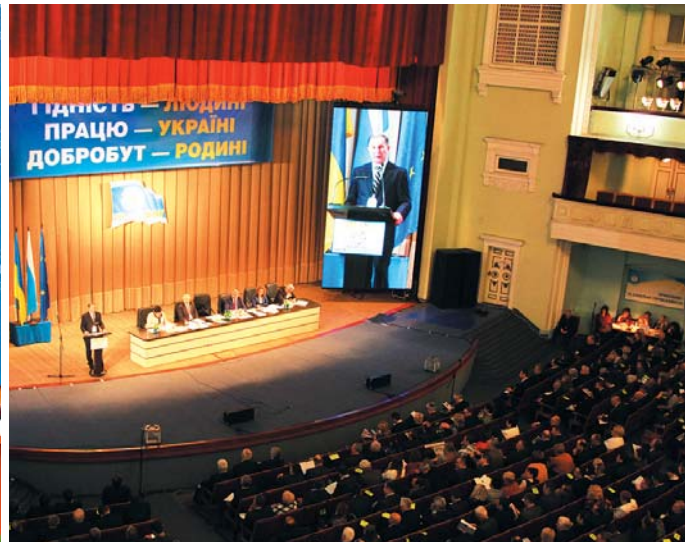
24 березня, м. Київ, МЦКМ (Жовтневий палац), VII з'їзд ФПУ

щорічного перерахунку пенсій у зв'язку із зростанням середньої заробітної плати в країні.