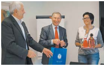
Зустріч з віце-президентом ЗФ Тіною Крістенсен

Основні напрями діяльності ЗФ: укладання колективних договорів (понад 90% членів ЗФ охоплені колективними договорами), страхування на випадок безробіття, профспілкова освіта та підвищення кваліфікації дорослих, участь і контроль за створенням належного виробничого середовища та соціальних умов праці, міжнародна діяльність та солідарність, інформаційна діяльність та робота із ЗМП.