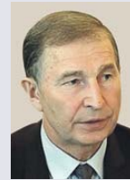
Григорій ОСОВІЙ, Голова Федерації професійних спілок України:

«Вимоги профспілок – не тільки щодо необхідності підвищення мінімальної заробітної плати до 3200