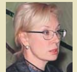
Людмила ДЕНІСОВА , міністр соціальної політики:

«Нині всі говорять про реформи, про їх необхідність. Але для того, щоб ці реформи були дієвими, нам необхідний чіткий курс. Маємо знати, в який бік іти, адже лише тоді можна бути коректно визначити, як саме. Якщо зараз це не усвідомити, то ми ризикуємо повторити долю реформ, які численні українські уряди проводили в 90-ті, коли зміни були симптоматичними, але неадекватними...».