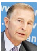
Григорій ОСОВИЙ Голова Федерації професійних спілок України

Сьогодні дуже непростий час для нашої держави, нашого народу. Ми бачимо, що багато хто не може залишатися осторонь тих подій, які відбуваються на сході країни, намагається допомагати державі, військовим, постраждалим. Профспілкам, як кажуть, сам Бог велів відгукнутися і долучитися до цієї діяльності. І Федерація професійних спілок України, її членські організації активно беруть участь у наданні соціальної допомоги учасникам Євромайдану, постраждалим унаслідок військових дій на сході країни, членам родин загиблих під час цих подій, постраждалим і вимушено переселеним особам із східних областей України та АР Крим.