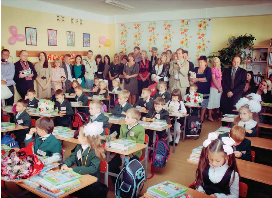
Аналітики не можуть спрогнозувати, як дорого обійдеться «придане» для школяра, але точно можна сказати, що 1 вересня для більшості родин стане «золотим»

стосують зброю, працюють волонтерами, перебувають у самому пеклі АТО. Діти мають отримати від учителя чітке пояснення зрозумілою їм мовою. Вони не сприймуть нездійснених обіцянок. Наші діти стали іншими. Надто дорослими для свого віку. Вони мусять чітко усвідомити, що держава і громадянське суспільство роблять усе можливе й неможливе для відновлення миру та порядку в країні, відбиття зовнішньої агресії проти нашої держави.