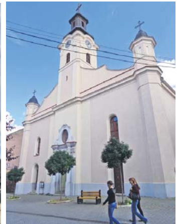
Римсько-католицький угорський костел Св. Юрія (Георгія)