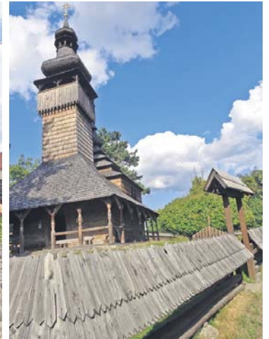
Музей під відкритим небом