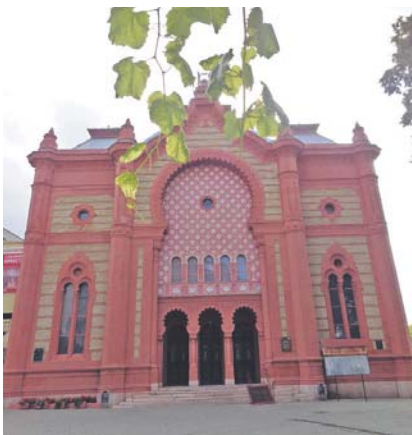
Колишня Ужгородська ортодоксальна синагога (нині Закарпатська обласна філармонія)