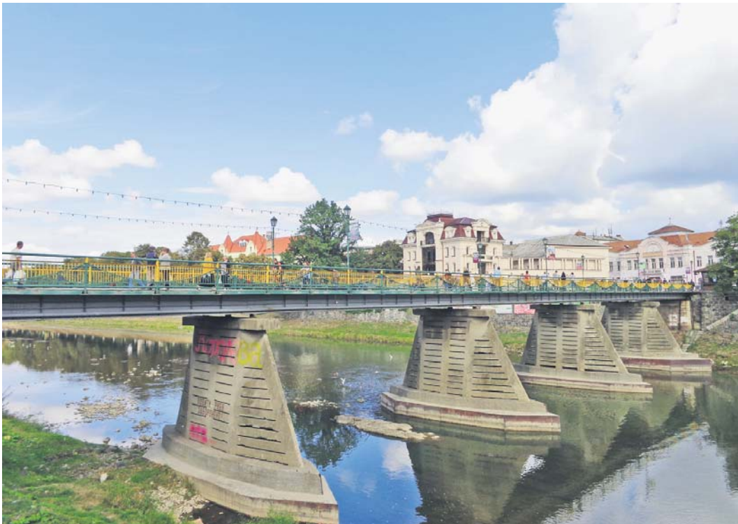
Ріка Уж, у долині якої зародилося місто Ужгород

Анна РЕПІЧ редактор відділу «ПВ»