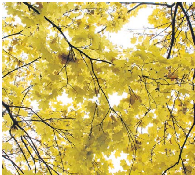
Золоті візерунки осені

РИБИ Намагайтеся стримувати свої емоції, інакше спровокуєте конфлікт. Ваші колеги спробують втягнути вас в інтригу. Не варто довіряти думці оточуючих.