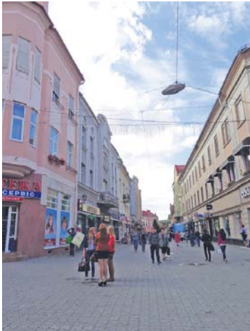
Старий центр міста, що нагадує Європу